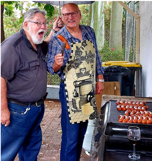
Revīzijas komisija pārbauda pavāru darbu

saudzis, ka, pat sēžot savā klubiņā, tomēr vēl esam zem viņa zariem.