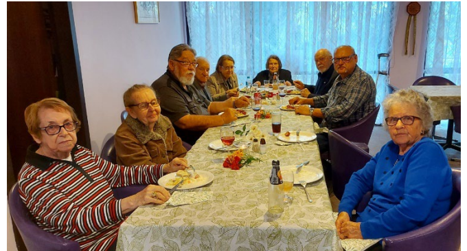
DVPertas nod. biedri un viesi : 'Zem Ozola'

Ukraiņu sabiedrības pateicības raksts Daugavas Vanagu nodaļai par ziedojumu (sk. Sv. Pāvila Draudzes ziņu (2. lpp)