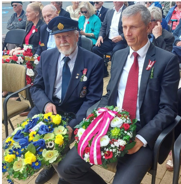
Vēstnieks nolika sarkanbalu lenti rotātu karogu latviešu karavīru godam, mana ciemata ceremonijā.

Pēc īsas apskates kur es dzīvoju, pusdienām ciemata restorānā, kāju skalošanas Indijas okeāna ūdeņos, Mandžūras pilsētas pastaigas un Rokinghamas apkārtnes apskates. Vēl pēc Fremantles pilsētas apskates no pieminekļa kalna, vēl arī varējām apskatīt skaistos Pertas nakts uguņu skatus no Kings Parka (ķēniņa parka). Tad vedu ciemiņus uz viņu dzīvokli, jo man jau vēl bija jābrauc atpakaļ uz Mandžūru. Nākamajā dienā nobraucām gar okeāna jūrmalas peldvietām apskatījām mūsu baltās jūras smiltis un tad aizbraucām uz "Kaveršamas" brīvdabas dzīvnieku parku, kur nu varējām redzēt gan Austrālijas dažādos dzīvniekus, gan putnus, gan čūskas, ķengurus un vēstnieka kundze varēja paaijāt Koala lācīti. Zvēru iežogojumi ir lieli un iekārtoti, pēc iespējas tādi kā šo dzīvnieku apvidus brīvā dabā. Saprotams visi ir tikai Austrālijas iedzimtie dzīvnieki. Parks ir liels, daudz ko redzēt un aizņemt daudz laika, bet liekās ka tad kad parku taisīja ciet, mēs laikam bijām lielāko daļu visu redzējuši. Ceļš veda uz mājām, jo rītdien atka jauna, aizņemta diena.